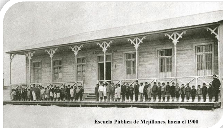
Escuela Pública de Mejillones, hacia el 1900